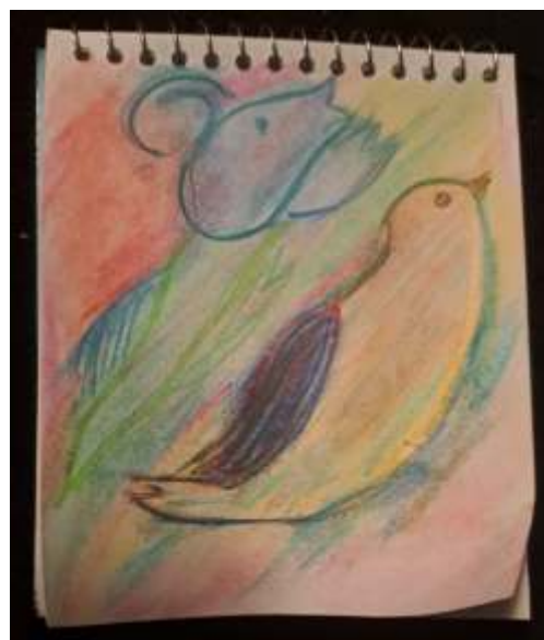
Tekening Diana Klein Kranenburg